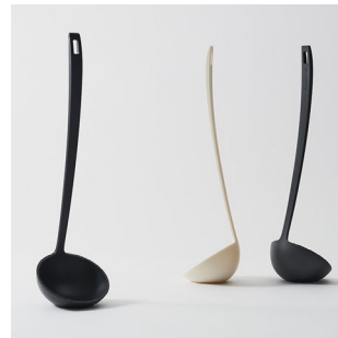
▲ +d タテオタマ スタンダードサイズ・ミニサイズの2種